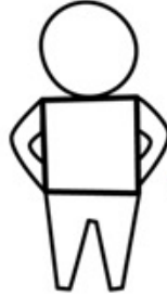
머리와 팔을 그려요.