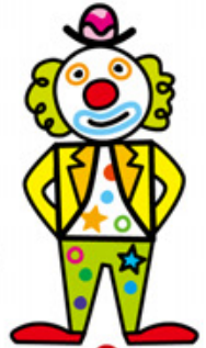
5 세세한 부분을 더해 어릿광대를 완성해요.