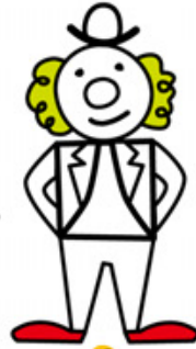
4 모자와 겹옷을 그려요.