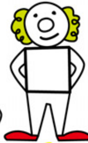
3 얼굴, 곱슬머리, 커다란 신발을 그려요.